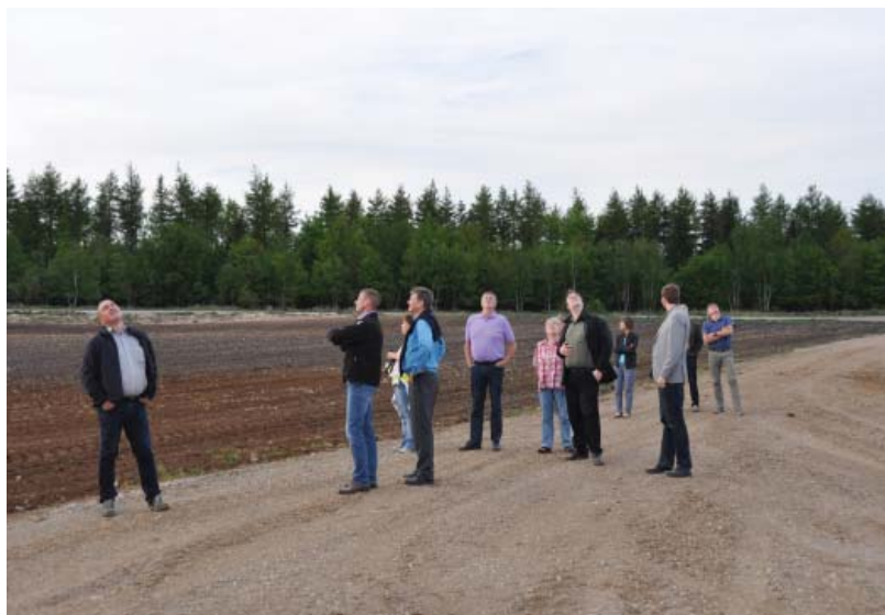
Borgerne kan inddrages ved at være med ud og se de konkrete områder.

Når idéerne er behandlet, laver kommunen et forslag til en lokalplan for det konkrete vindmølleområde, som bestemmer, hvor og hvordan der kan sættes vindmøller op, f.eks. hvor mange møller